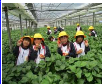
1年生 イチゴ狩り体験