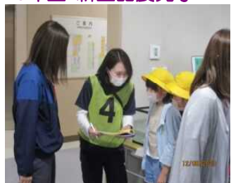
全校生 引き渡し訓練