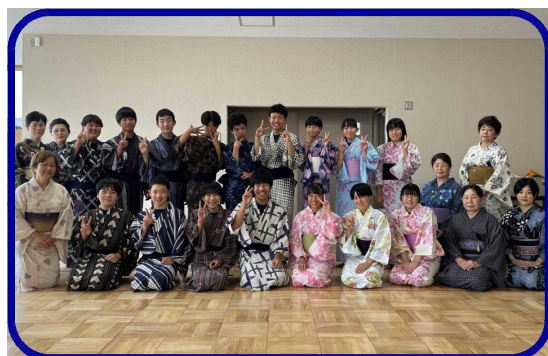
9年生の浴衣着付け体験

今後は前・後期課程の子供たちが共に生活する義務教育学校としての在り方をより深く追究し、地域との連携を密にした特色ある取組を行っていききたいと思います。そして、子供たちが良き出会いと豊かな体験活動を通してより良い生き方を考えられるよう心を育んで参ります。今後とも御理解・御協力をお願いいたします。