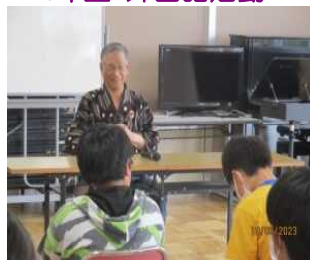
6年生 塩原語り部の会