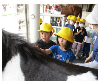
2年生 騎手養成所見学