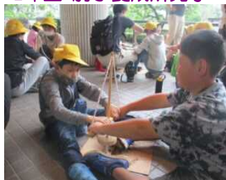
6年生 火起こし体験