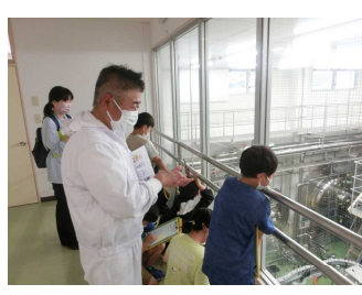
3年生 新生酪農見学