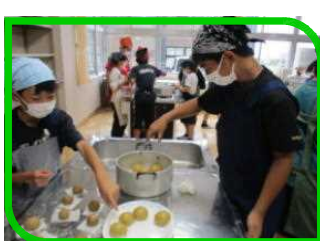
炭酸まんじゅう作り