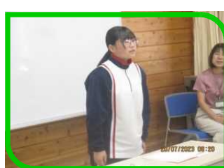
夏休み前全校集会