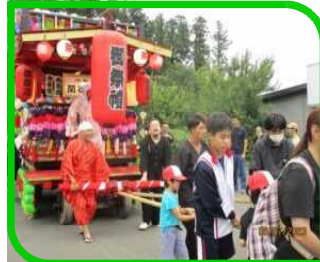
関谷・下田野地区八坂神社祭り