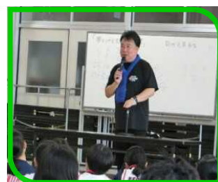
とちぎ未来大使夢講座