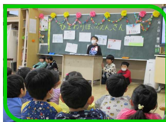
保育園生との交流会