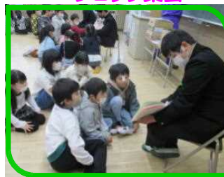
9年生との交流活動