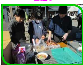
地域学校お助け隊