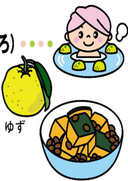
ゆず かぼちゃと小豆のいとこ煮

1年で最も昼が短く、夜が長くなる日。ゆず湯に入って身を清め、かぼちゃや小豆を食べて邪気をはらい、無病息災を祈る風習があります。